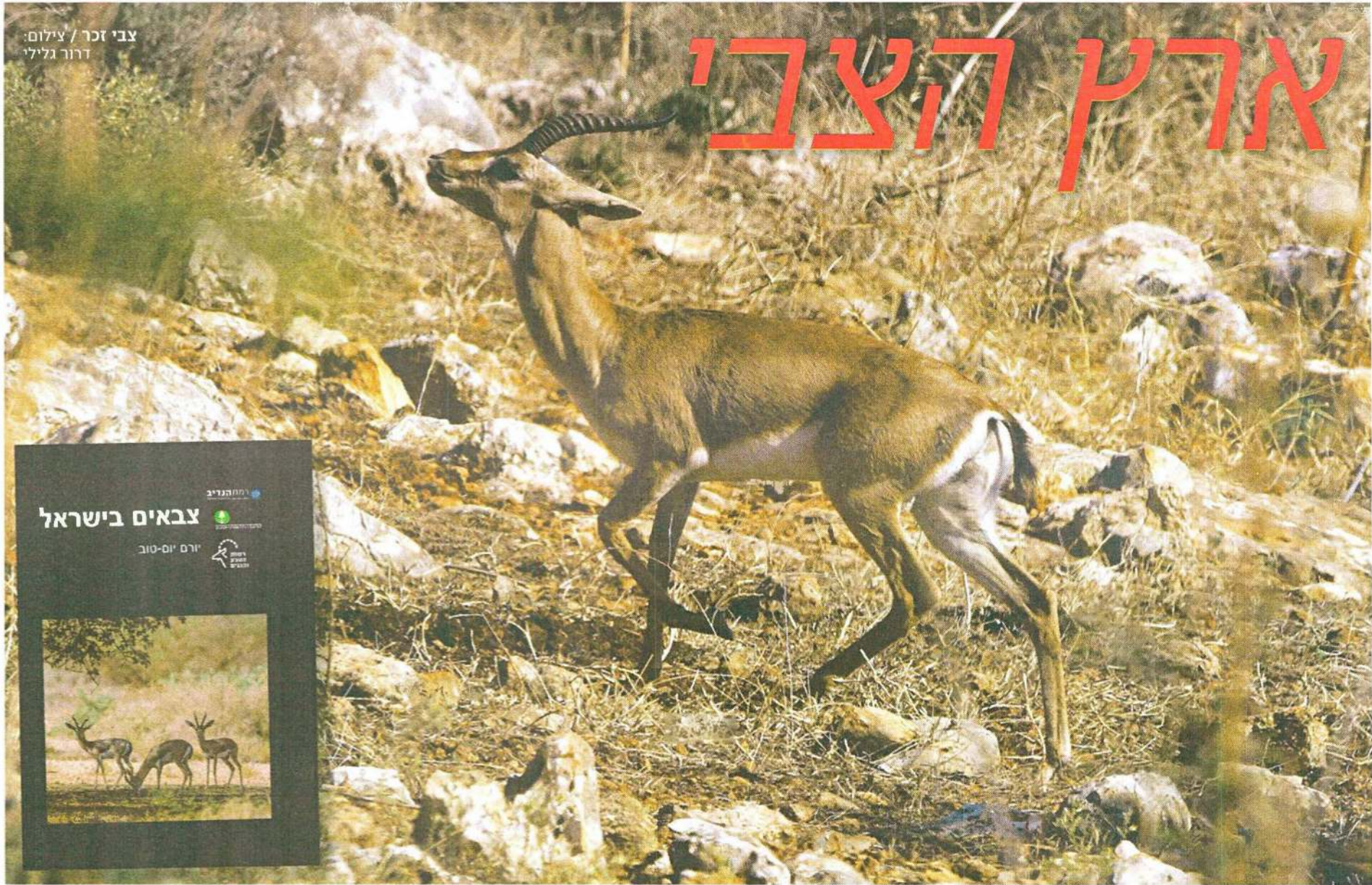
צבי זכר