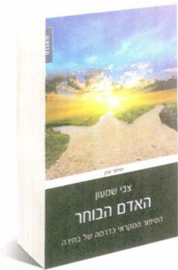
האדם הבוחר צבי שמעון הוצאת 'מאגנס' / 310 עמ'

ההכרעה בין רע לטוב מורכבת ומסובכת עבור הדמויות המקראיות. צבי שמעון, ד"ר למקרא, דן בסוגיית הבחירה האנושית מהאדם הראשון ועד דוד המלך