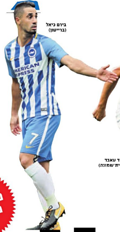
בירם כאל (ברייטון)