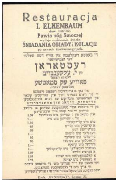
Smocza. קפה וטרו מעוצב פינת הרחובות סמוצ'ה ואנילביץ'