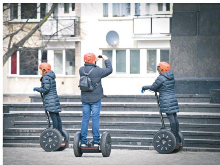
אז והיום. למעלה: רחוב סמוצ'ה כפי שהיה בשנות ה-30. למטה: תיירים מסיירים בשכונה שנבנתה על חורבות הגטו

נדמה לי שתושביו המקוריים של סמוצ'ה הסכימו בשתיקה לאופן הצנוע שבו אני רוצה להציג אותם. רובם ממילא לא הלכו בגדולות ולא היו בארמונות. אדרבה: בבית שיוכון אחד ברחוב - כלומר, שלושה בניינים בצורת ח"ת, בני המש קומות, ובדירות חדר בעיקר - התגוררו מאות רבות של אנשים.