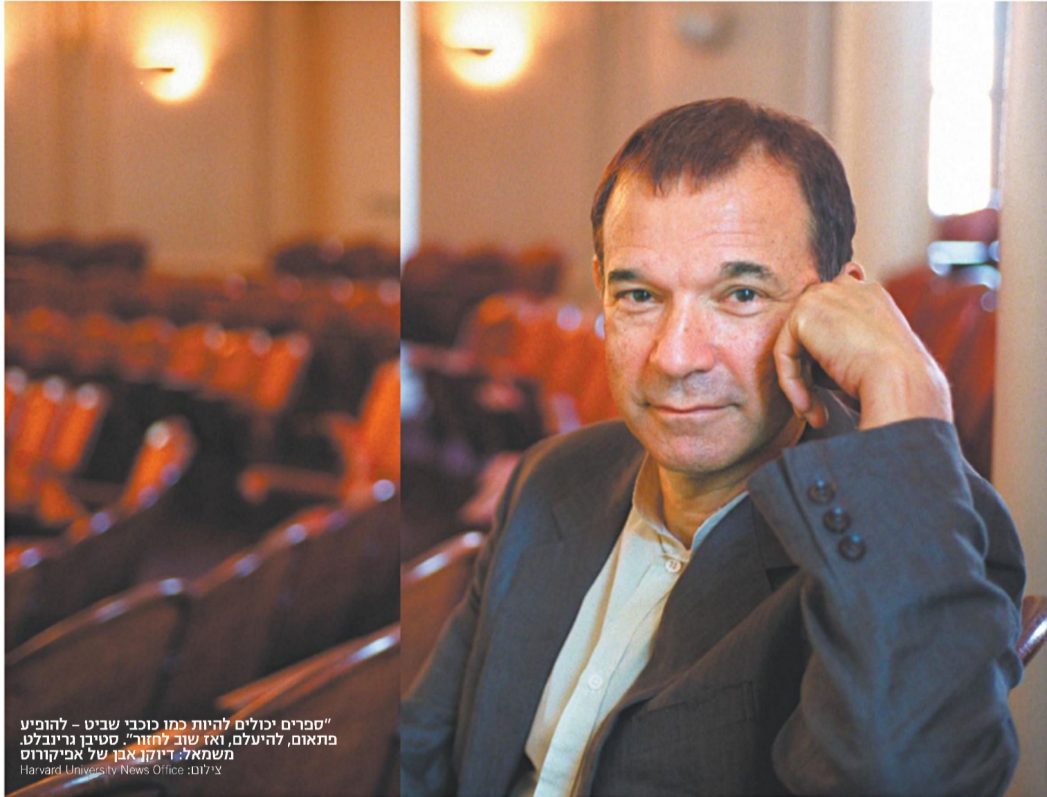
"ספרים יכולים להיות כמו כוכבי שביט - להופיע בתאום, להיעלם, ואז שוב לחזור". סטיבן גרינבלט, משמאל: דיוקן אבן של אפיקורוס

כמאורות גדולים קאנונים; אבל ספרים יכולים להיות כמו כוכבי שביט, שמופיעים באופן פתאומי, משפיעים על אנשים - ואז שוב נעלמים. הם יכולים 'לחזור' באופן שונה בתקופות שונות.