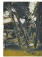
אהרן אפלפלד הפסגה

לייצב את רגליה על הקרקע ולקרוע משרו של אותו חבוש ענק. העולם היה מסוג החבושים העקשנים שקי ליפתם קשה". ומגב הספר: "בית הדפוס המשפחתי הוא ליבו של הרומן (...) סיפור על (...) אהבה עמוקה לסי פרים, למלים ולאותיות העבריות" (כתר, 256 עמ').