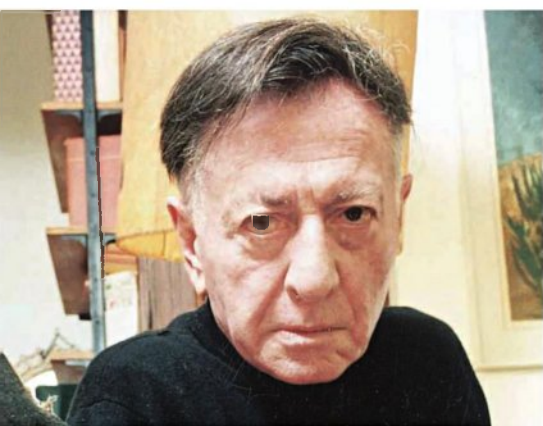
"לפעמים יצא לו קסם". אלוני

"הקורא הוא אדם דומה לי, תרבותי כמוני". הנדלזלץ