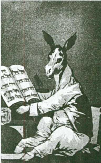
על משכילים וחמורים. 'עוד בימי סבו', פרנסיסקו דה גויה, 1798