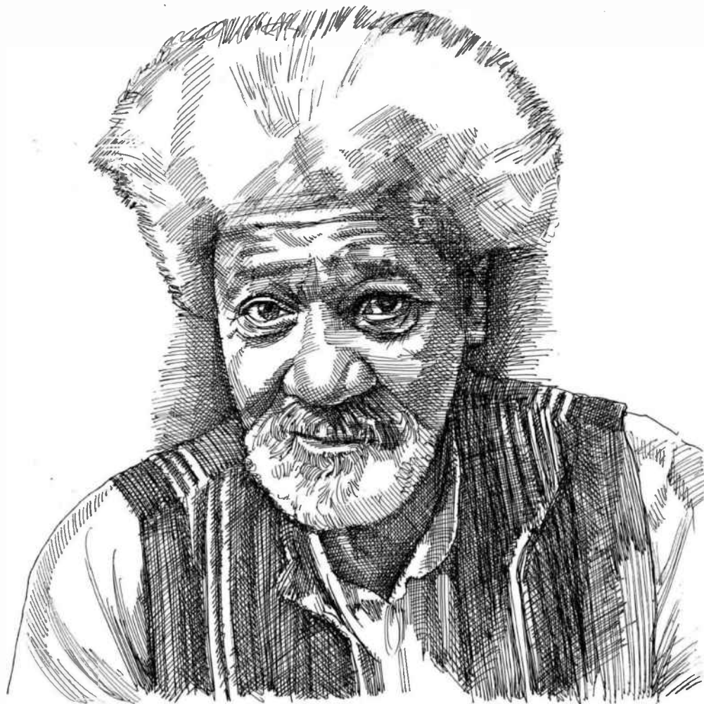
וולה סוינקה. איור: גל ביבלי

וולה סוינקה (Wole Soyinka) או בשמו המלא: אַקוֹיִנוֹנְדָה אולוֹלֵה סוֹיִנְקָה (בעברית גם היו שכתבו את שמו סוֹיִנְקָה), הוא משורר, הוגה, מוסיקאי ומחזאי, נולד בניגריה בשנת 1934. השלים תואר בספרות אנגלית ושימש כקריין מחזות בתיאטרון המלכותי בלונדון. בין השנים 1967-1969, ימי מלחמת האזרחים בניגריה, נעצר ונכלא על מחאתו הפומבית כנגד מעשי הרצח ההמוניים שבוצעו בהוראת הממשלה, כגון הטבח בטנגל (1966). שנים ארוכות ערך את כתב העת האפריקני לשירה "אורפאוס השחור". זכה בפרס נובל לספרות בשנת 1986, והיה ראשון הזוכים האפריקניים בתולדות הפרס. מונה לשגריר של פבד של האו"ם להפצת התרבות האפריקנית. בשנת 1999 הואשם על ידי גנרל ניגרי בבגידה, מכיוון שקרא פומבית להפסקת מעשי הרצח האתניים במדינה. מעבר לפעילותו הספרותית השוקקת, חיבר ספרי הגות, העוסקים בתרבויות אפריקה, בביקורת תרבות ובפאן-אפריקניות.