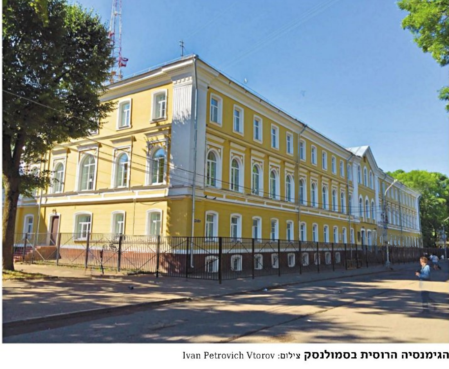
הגימנסיה הרוסית בסמולנסק

תוך כדי קריאה ב"גימנוזיסטים" נוכרתי בספרו של א"א קבק "לברה" (הוצאת "תושייה", 1905). יש לציין שספרו של קבק התייחס לבני דור מאוחר יותר מאשר "הגימנוזיסטים", אלה שחלמו שבע"לייה לארץ ותגשמה כל התקוות). קבק מתאר שם את השפעות הגימנסיה על הנערה היהודייה שנדרשה ללמוד בימי שבת ואף לכתוב על הלוח.