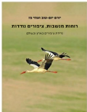
עטיפת הספר צילום: יוסי אשכול, עיצוב: משה מירסקי, הוצאת דן פרי

ספרם את מכלול השאלות שעוררות מנדידת ציפורים. כל אחת מהן היא תעלומה שראויה לסדרה בלשית טלוויזיונית: מה הסיבות לנדידה? כיצד ומתי התפתחה? איך יודעים העופות שהגיע הזמן לצאת לדרך? איך הם בוחרים את היעד? איך הם מנווטים? איך הם יודעים שהגיעו ליעד? מה השינויים שמתחוללים בגופם? הספר מחולק לשני שערים.