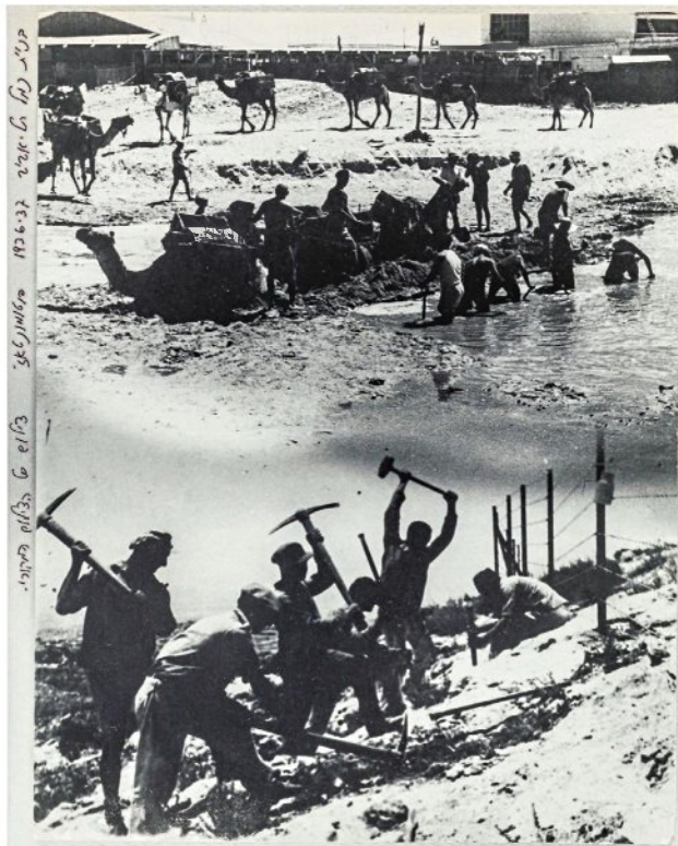
תל אביב, עיר נולדת, 1936-1937