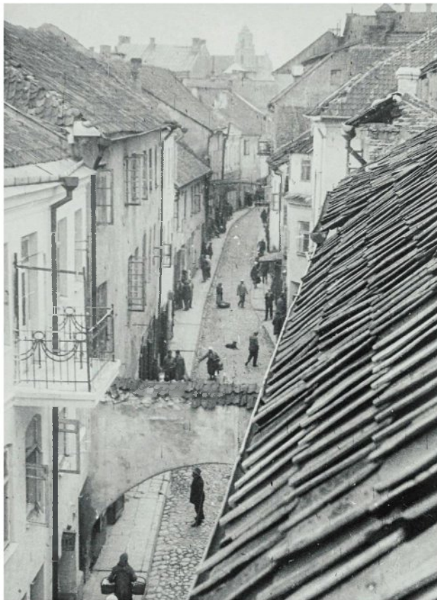
רחוב שולהויף (חצר בית הכנסת), 1928-1929

לדחיקתו מהקנון הישראלי: "הרבה שנים נחשב הצילום כאן אחר חורג בשדה האמנות, כי היתה לו את 'הילת המגויס'. קחי מקבילות בעולם, למשל את הריאליזם הסוציאליסטי ברוסיה — כמה תערוכות וספרים הוקדשו לנושא בעולם. בישראל כל מה שהיה מורדניסטי, אלטרנטיבי או אחר בשדה הצילום לא זכה להכרה ונדחק לשוליים על ידי הממסד המוויאלי עד שנות ה-90".