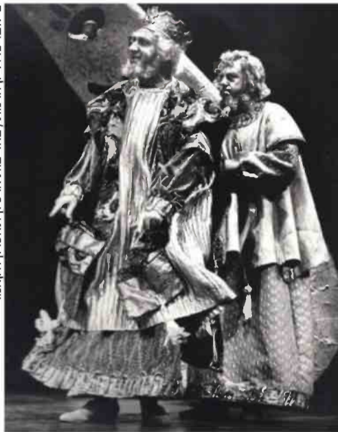
מתוך המחזה של שבתאי "כתר בראש", 1969

אחר: "היתה תחרות ביני לבין יעקב. יעקב היה אהוב על כולם, ואני לא הייתי בתחרות. אבא שלנו העריץ אותו אבל גם קינא בו, משהו אדיפלי כזה, שהוא היה אהוב של אמא ולא האבא עצמו. אני הייתי דמות יותר שולית מהבחינה זו. "יש לי זיכרון חזק - הופעתי בבית הסופר כמשורר צעיר בן 20, ופתאום קם אדם מהקהל, מתרגם, ולעג לשירים שלי, ואבא שלי קם מקצה האולם וצעק, 'איך אתה אומר את זה, אתה לא מבין את השירים האלה'. ואני לא הזמנתי אותו לאירוע, אבל היה לו חשוב. אלה דברים שאני זוכר לזכותו".