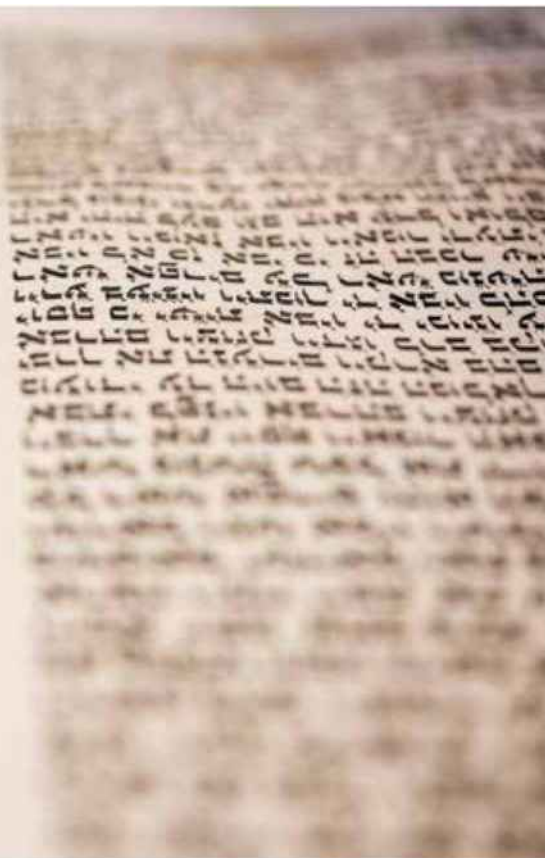
מה שכתוב בתורה ומה מצופה שיהיה כתוב בה

לאחר המבוא, שבו דן ויזל באופק הציפיות מהתורה, באים חמישה פרקים כרונולוגיים. בפרק