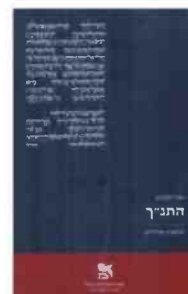
התנ"ך: מהפכת אלוהים יאיר זקוביץ' מאגנט, תש"ף, 283 עמ'

שני צירי תנועה משתלבים בספר: הציר האחד הוא מזמורות שבעל פה דרך איסופו, עיצובן והעלאתן על הכתב, אל יצירת הטקסט הקנוני והפצתו. הציר השני מוביל את הקורא דרך הצמתים העיקריים של המקרא כספר: התורה, הספרים ההיסטוריים, ספרות