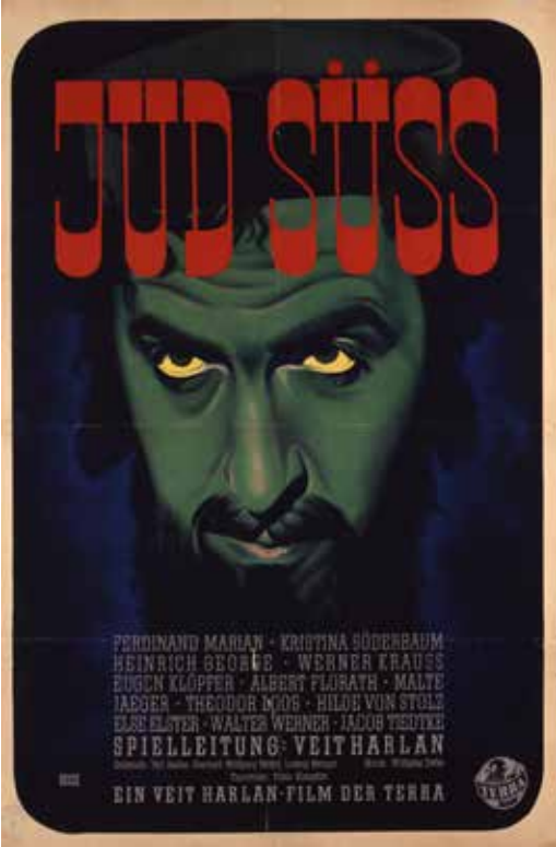
עלילה שהפכה לשואה. כרות סרט התעמולה הנאצי: "היהודי זיס"