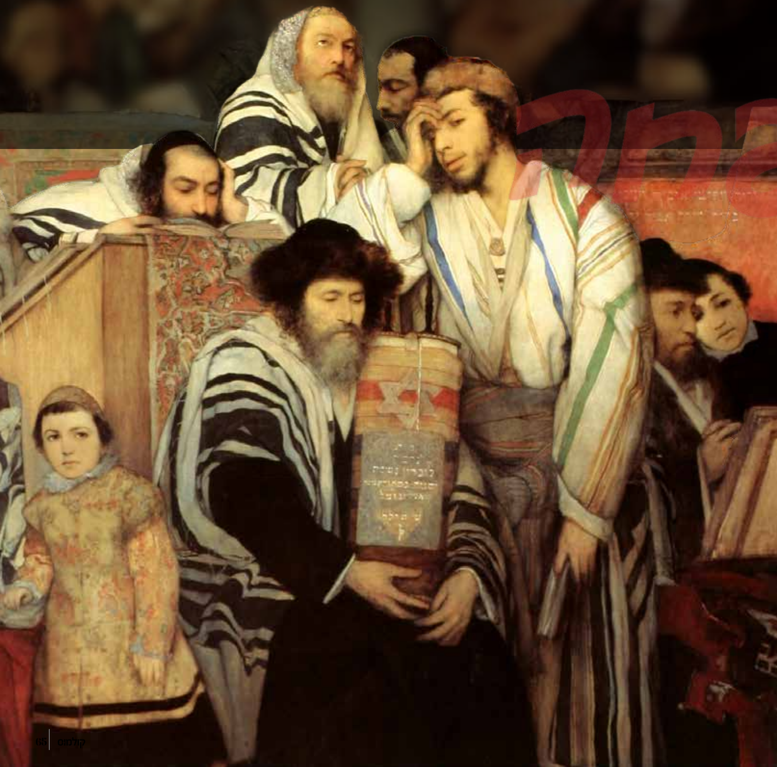
ניגון מסיני. הציור "כל נדר" מאת הצייר משה מאוריצי (מאוריצי) גוטליב

אם במשך שנים שמענו על 'עלילות דם', הגיע הזמן להכיר את 'עלילת הרעש' | במשך יותר מאלף שנים האשימו הנוצרים של אירופה את היהודים בכך שהם מרעישים ומייללים | מה שהתחיל בימי הראשונים, נמשך עד לתזמורת המפורסמות של לא הושר הצליל האחרון