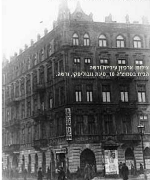
הבית בסמוצ'ה 10, פינת נובוליפקי, ורשה.

"בפירוש לא. חלק מהעיתונים סרוקים, אבל לחפש בהם אזכור לסמוצ'ה זה כמו לחפש מחט בערמה של שחת. זו משימה שאי אפשר שלא להיכשל בה. היכולת לחפש את המילה 'סמוצ'ה' בארכיון העיתונות היהודי אפשרה לי למצוא אלפי אזכורים לרחוב. העיתונים כתבו גם על המאורעות היומיומיים שהתרחשו - מלצר שמתאהב בנערה ואינו יכול לשלם על החתונה, ילדים ששיחקו בגפרורים ושרפו את הבית. הנורמה העיתונאית של אותה תקופה הייתה לציין את השם המלא והכתובת המדויקת של כל אדם שנכתבה עליו כתבה. כך יכולתי לבנות את הנרטיב של הספר, לעבור מבית לבית, להכיר את האנשים שגרו שם.