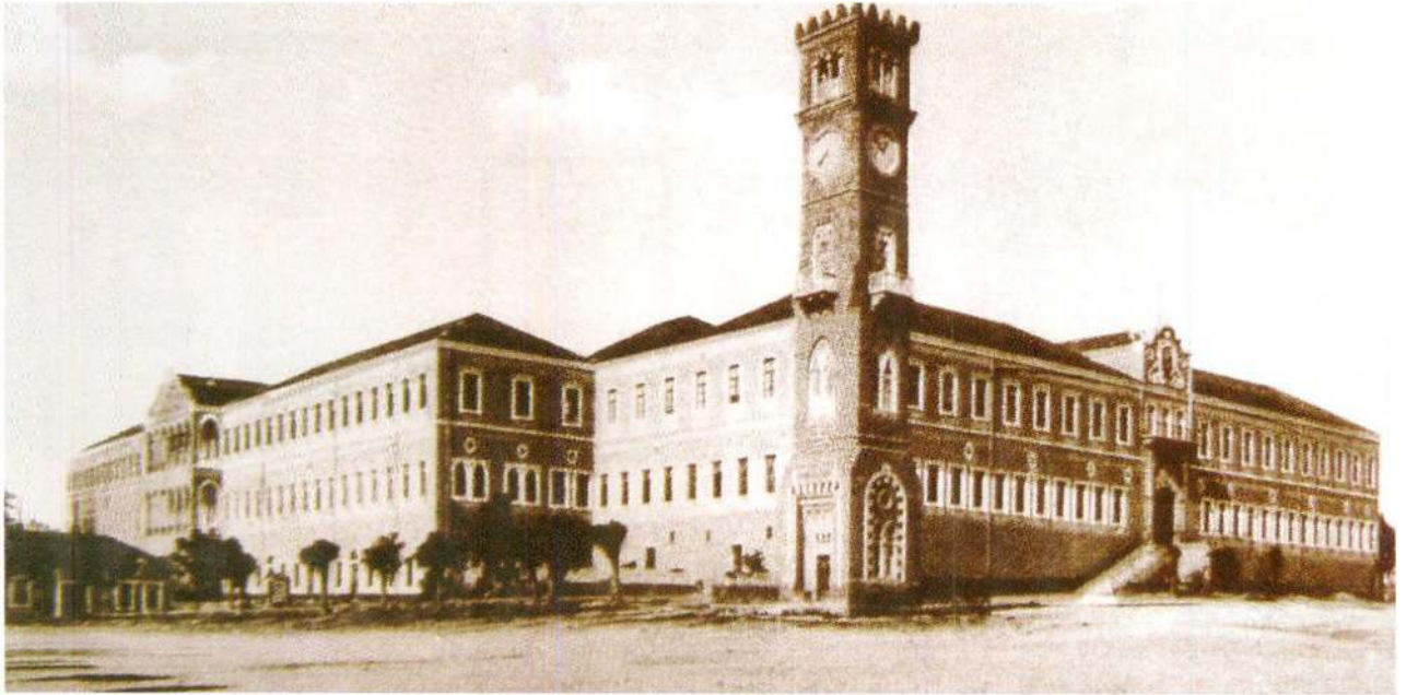
החשש שהשעון האירופי ישתלט הניע את בנייתם של מגדלי שעון במזרח התיכון. מגדל השעון בביירות, סביבות 1900

התורכית החליפה את האימפריה העות'מאנית, נחקק חוק שהפך את השעה האירופית לשעה החוקית היחידה. הספר נחתם בצייטוט ארוך ונוגע ללב של סופר בשם אַהְמַד האשם המקונן על הזמן האבוד של השעון המוסלמי: