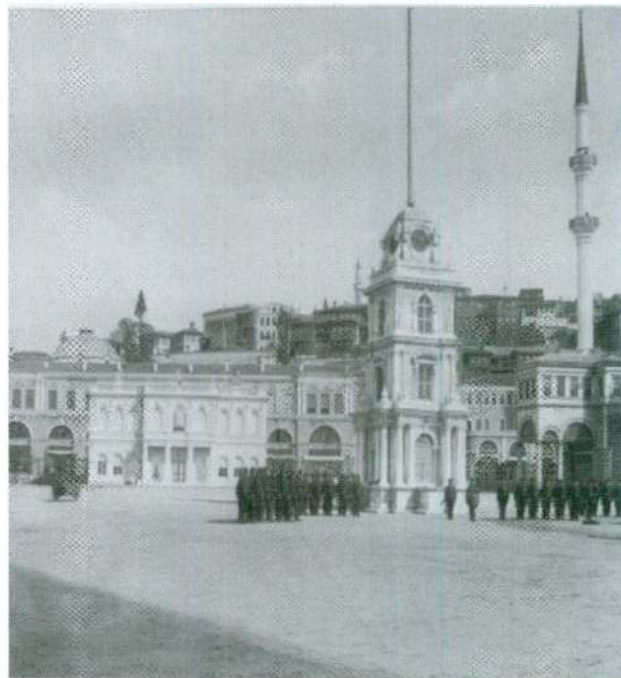
פתחו שעון. עמידה בזמנים הייתה חלק משמעותי מהנשרת החייל העות'מאני המודרני. מסדר צבאי ליד מגדל שעון באיסטנבול, סוף המאה ה־19.

הפתגם העממי, המייחס מקור עליון לחיפוזן ולסבלנות, מדגים עד כמה משמעותית הבחירה בנושא ההיסטוריה של תרבות הזמן.