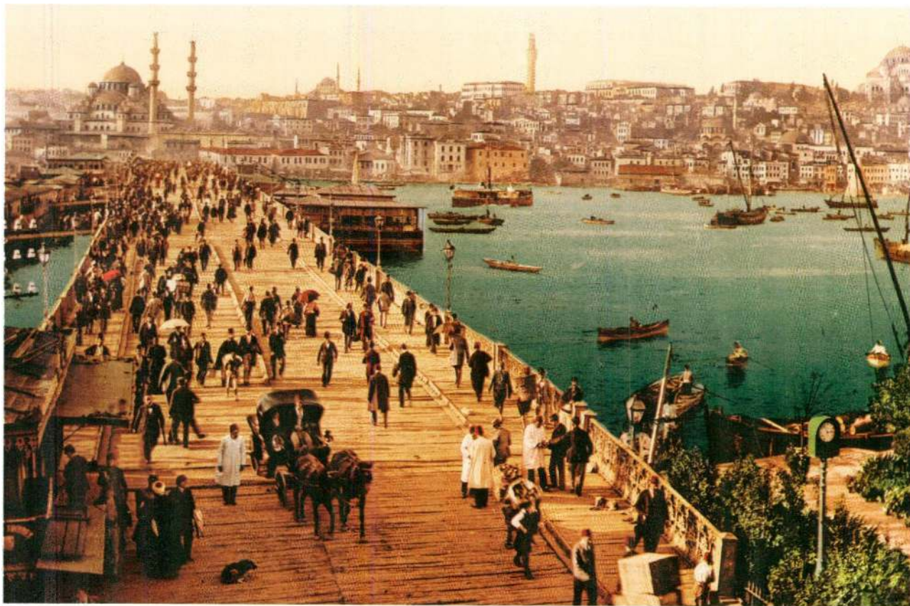
המודרניות העות'מאנית שילבה בין המוסלמי למערבי ויצרה חידושים עות'מאניים מובהקים. שעון ציבורי מימין לגשר גלאטה שבאיסטנבול, סוף המאה ה־19

הייתה מושבה אירופית. הדעה הרווחת היא שתהליך המודרניזציה העות'מאנית – התנזימאת – הונע בלחצן של המעצמות, אך המחבר טוען כי התהליך נבע גם מצורכי האליטה העות'מאנית עצמה. בהתייחסו לתקופת שלטונו של עבד אל-חמיד השני בסוף המאה ה־19 הוא כותב: