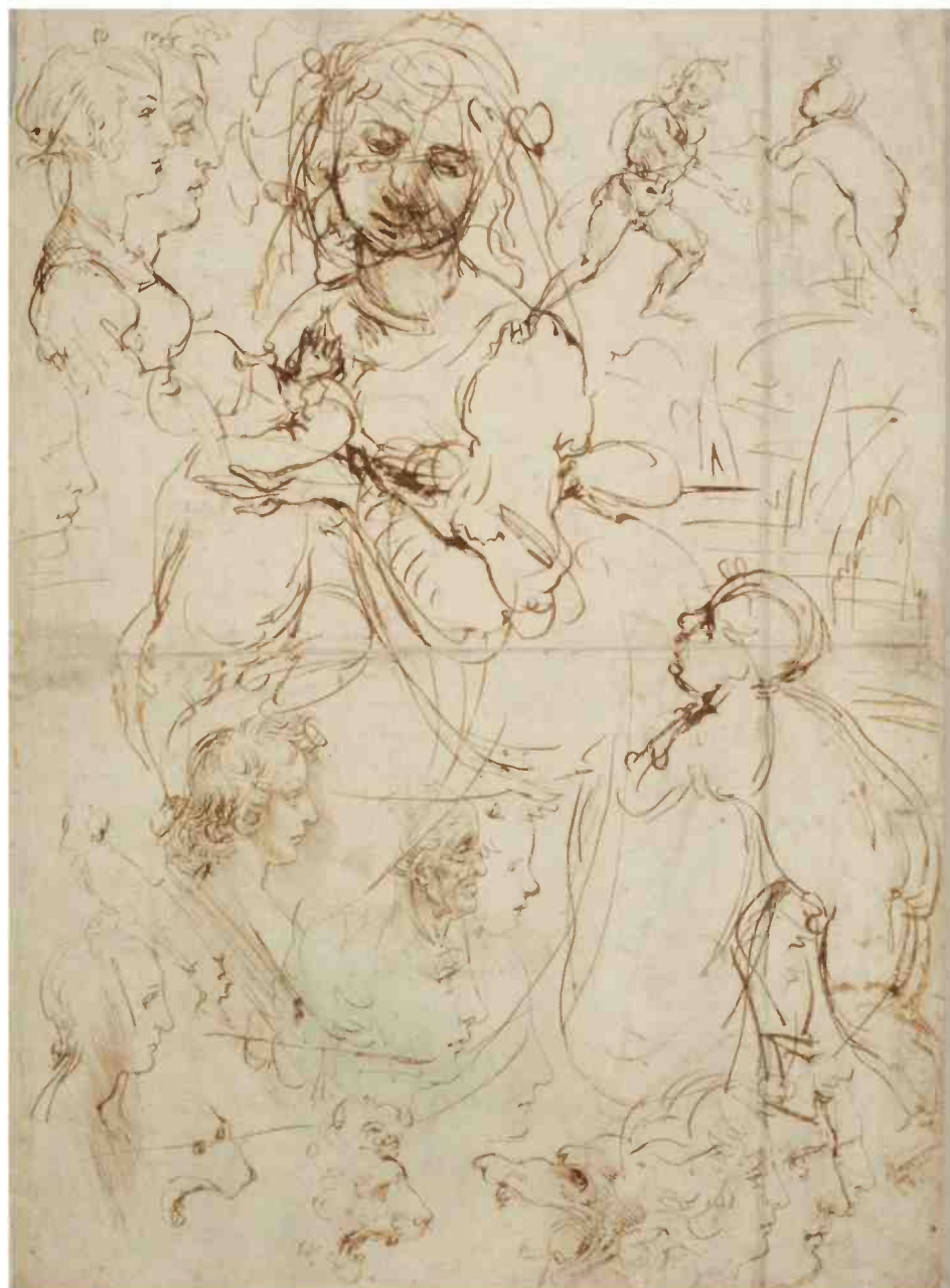
מדונה וילד עם יוחנן המטביל התינוק וראשים, 1478 לערך

הגיאומטריה המופשטת והמציאות המוח- שית מתערבבות – והרי כך פועלת תודעת צייר, שרואה משולש ישר זוויית במקום שאדם רגיל רואה רק אף. בצד הסדר נמצא כאן כמה רישומי הכנה מושלמים, למשל שני ראשים של שליחים לציור "הסעודה האחרונה". ברו- רים, חד-פעמיים, נחרצים. מתוך התנועה