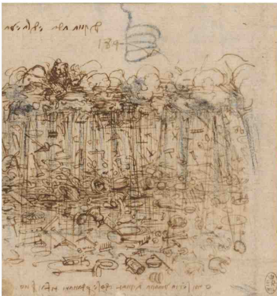
לאונרדו דה וינצ'י, שבר ענן של חפצים, 1512-1506 לערך

... אילו היה חציו השמאלי של הדף הזה בן ה-500 מוסתר, היה אפשר לחשוב שזהו רישום של מפל מים. מפל רך, רשום בגיר אדום על נייר, גולש חרש ומתנפץ כמעט בלא קול, נקווה אל מקום אחד, מקציף, שוהה קצת לפני שהוא ממשיך לזרום אל הנהר ואל הים. אבל חציו השמאלי של הדף אינו מוסתר, והמפל אינו אלא שערו הרך, הארוך, של גבר יפה: זהו לאונרדו דה וינצ'י, ואת הדיוקן רשם כנראה פרנצ'סקו מ'לצי, תלמידו, שנתיים-שלוש לפני מותו של המורה. בגלריה של המלכה בארמון בקינגהאם בלונדון מתקיימת עתה תערוכת רישומים של לאונרדו לרגל שנת ה-500 למוותו. בחודש הבא תיפתח תערוכה גדולה יותר בלונדון. זהו דיוקן נסיכי. הוא עדין כמו הכל פה על זגוגית ביום קר. האם נוכל למצוא היום, בין מיליונים של תצלומי פני אדם, כזה רך, כזאת אהבה מהולה בכבוד? מצד אחד הראש הזה בוקע מתוך גלים, כמו סלע ממים, ומצד שני אין בו כל כוחנות. אנו מכירים צדודיות רבות של קיסרים (על מטבעות, למשל), המביטים מתוך תחושת גדלות כוזבת הצדה, כניכול לניצח, מצפים למבט מעריץ וירא של נתינים. לא כך הדיוקן של לאונרדו. מבטו רך כמו שער, וגם אפו שניצב לפניו כמשולש ישר זווית מס' פרי גיאומטריה, מאזן בתקיפות קלה בלבד את החופש של גלישת השיערה אוזונו הכמוסה ברעמה הופכת את הווייתו למכונסת בעצמה, כמוסה מאיתנו. העין והאף פונים שמאלה, השיער גולש למטה ונעלם אל תוך האיזן של הדף. האם עודנו יודעים להתבונן כך באדם אחר? לראות את הרוח הנושבת בפניו, את סוד הווייתו? מדוע אין כמעט רישומים כאלה בגלריות לאמנות? האם אנחנו כבר באמת מע' בר לזה?