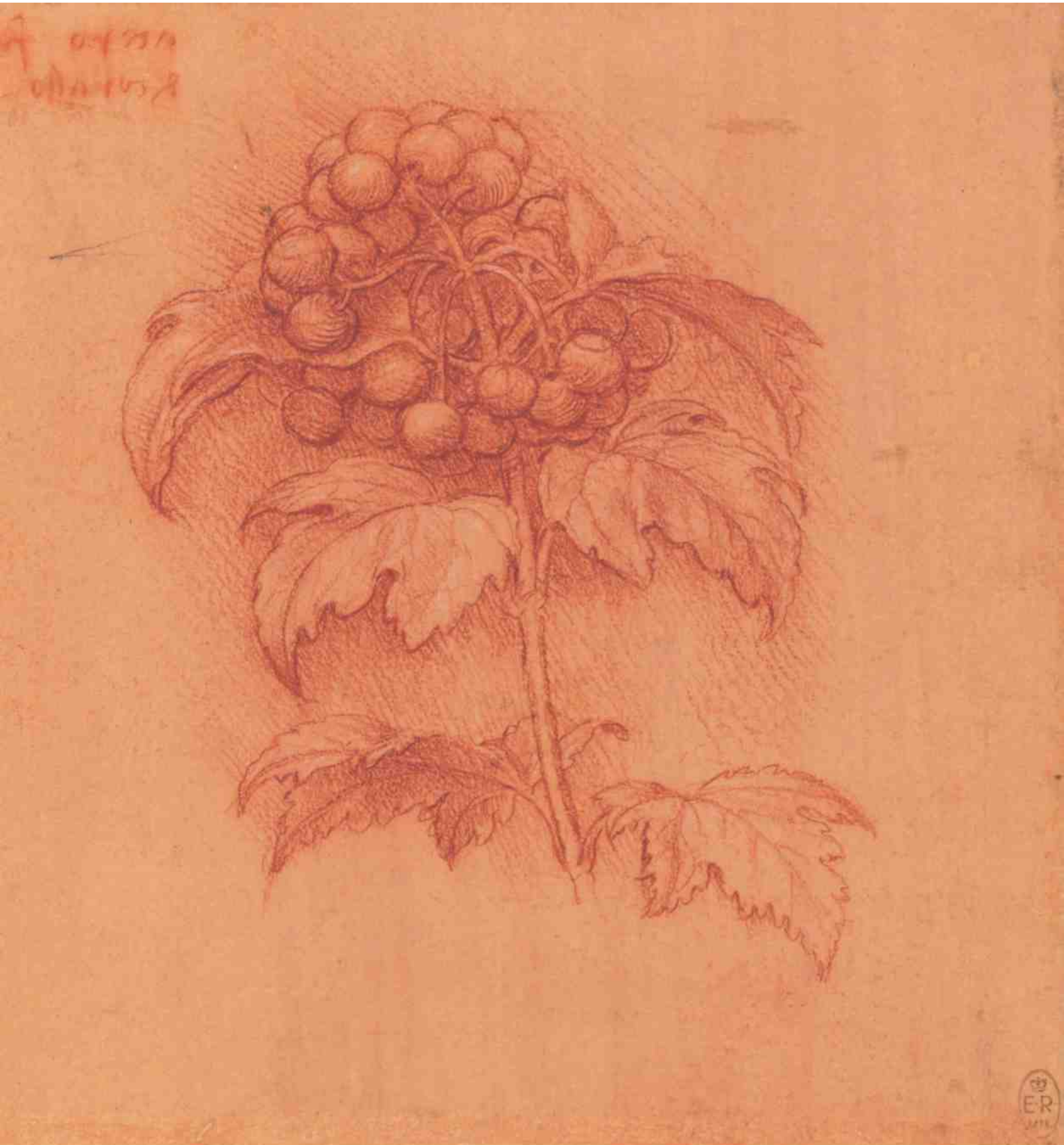
ענף של מורן, 1512-1506

האיטלקי בכלל: מחשבה בהירה, הומניסטית, מדודה ומודדת. אבל כך כותב לאונרדו עצמו: "תשוקתי הלהוטה משכה אותי, השתוקקתי לתפוס את הגודש העצום של כל הצורות המזורות והנבדלות שיצר הטבע האמנותי, ואחרי שני דדתי מרחק מה בין הסלעים התלויים באתי אל פי מערה גדולה שלפניה ניצבתי נדהם ונפעם כי לא ידעתי על קיומו של דבר שכזה... התכו-פפתי לצד זה ולצד זה כדי לראות אם אוכל להבחין במשהו, אף על פי שזה היה בלתי