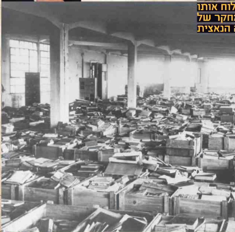
חזרו הביתה. הספרים שנתפסו בגרמניה לאחר המלחמה