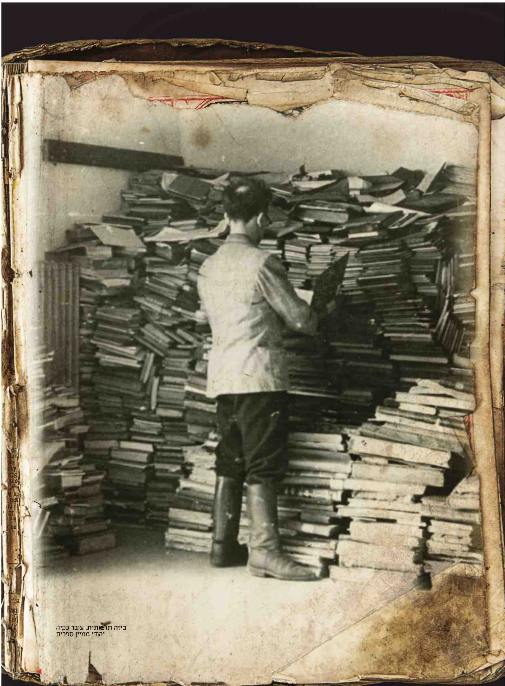
ביזה תרבותית. עובד כפיה יהודי ממיין ספרים