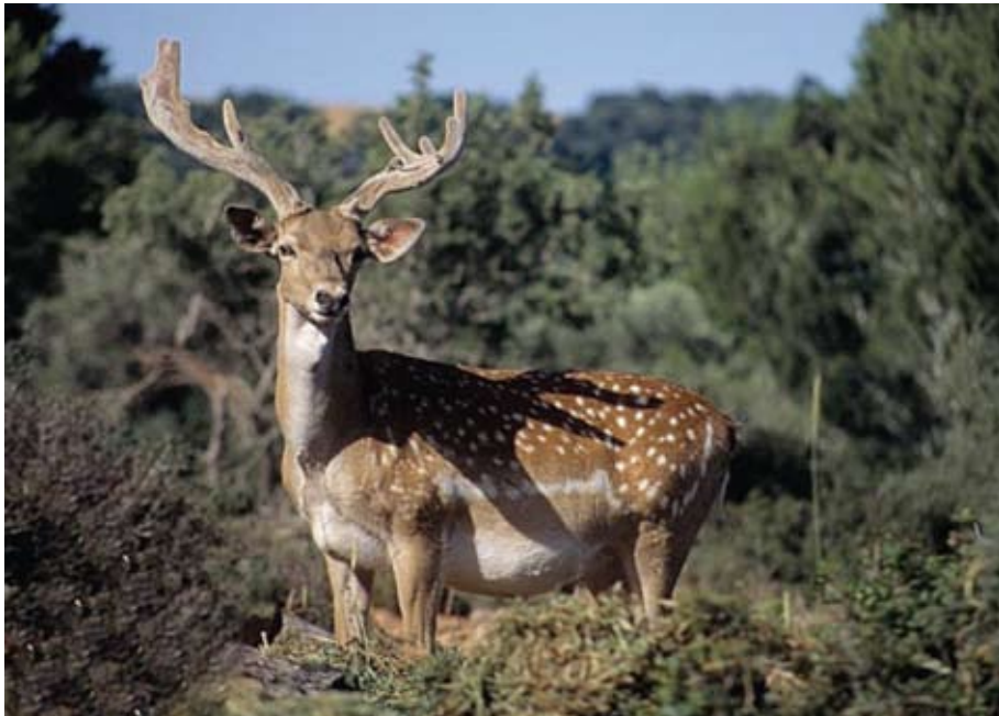
יחמור פרסי (זכר). מין זה של אייל הושב לטבע בארץ על ידי רשות הטבע והגנים.