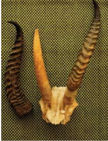
תקרת הגולגולת של צבי ארץ ישראלי. מעטפת הקרן של אחת הקרניים הוסרה ובסיס העצם נחשף.