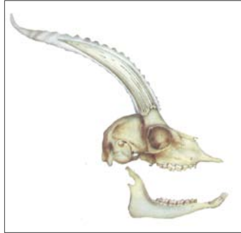
גולגולת צבי. המעטפת הקרנית יושבת על בליטת עצם. צייר טוביה קורץ

בסוף המאה ה-18 ובמהלך המאה ה-19 החייתה תנועת ההשכלה באירופה את השפה העברית. המחסור בשמות עבריים לבעלי חיים העסיק את הסופר שלום יעקב אברמוביץ, הידוע בכינויו מנדלי מוכר ספרים (1836-1917). למיטב ידיעתי, לא היה מי שעלה עליו בהענקת שמות עבריים לבעלי חיים. ממקום שבתו ברוסיה, תרגם מנדלי מוכר ספרים ללשון העברית ספר העוסק בנפלאות הטבע. בהקדמה לספרו "תולדות הטבע" מסביר מנדלי מוכר ספרים את הסיבות שהביאו אותו לכך: