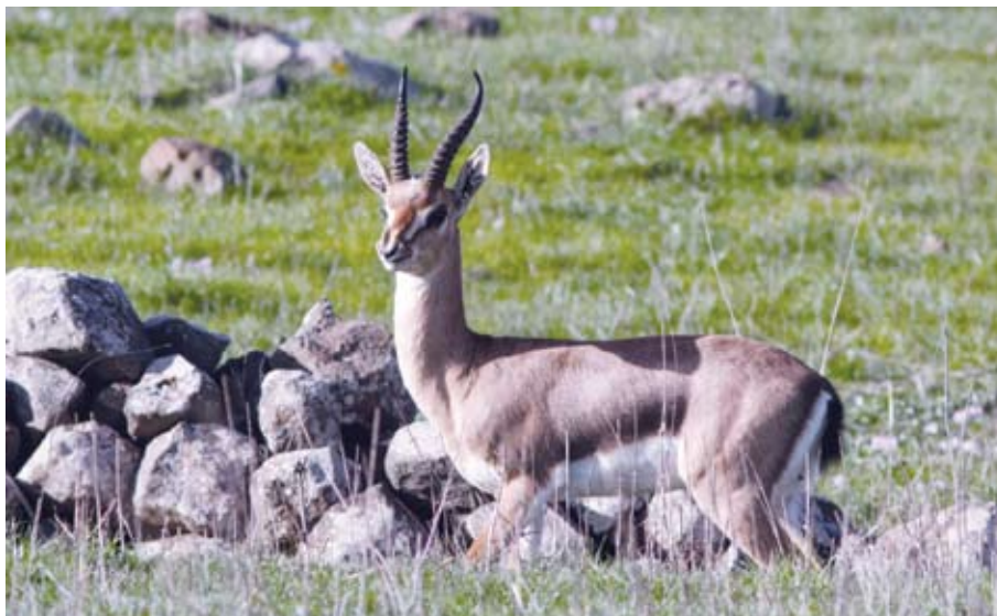
צבי ארץ ישראלי, זכר בפרוות חורף.

אחד מכינויי החיבה לארץ ישראל הוא "ארץ הצבי", ולא בכדי. הצבי מזדמן לעיני המטייל באזורים שונים ברחבי הארץ - ממרומי הגולן ומורדות הרי נפתלי ועד לרחבי הנגב ודרום הערבה. הצבאים הם מהיונקים המעטים הנראים למטייל מן השורה, גם אם אינו זואולוג. הסיבות לכך הן שבניגוד לרוב היונקים בארץ, הצבאים פעילים ביום וממדי גופם גדולים יחסית. בארץ ישראל מוכרים כמאה מיני יונקים חיים בר. מלבדם מזדמנים לחופי הארץ כתריסר מיני יונקים ימיים.