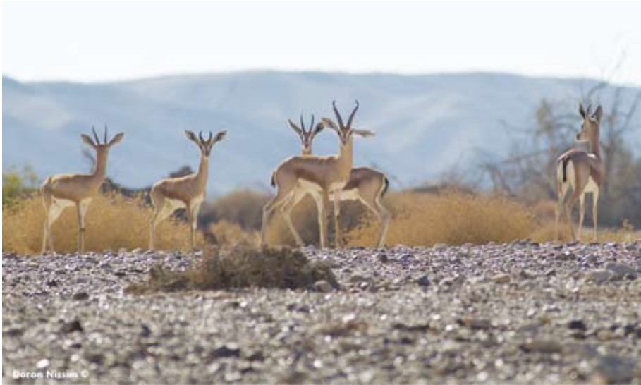
צבי המדבר. חשיף (עדר קטן) ובו זכר בוגר (לפנים), שלוש נקבות וזכר צעיר (משמאל).

עם היונקים הגדולים בישראל נימנים טורפים אחדים ופרסתנים. הטורפים הגדולים הם הזאב ( Canis lupus ), הנמר ( Panthera pardus ) והצבוע ( Hyaena hyaena ) ואילו הפרסתנים הגדולים הם חזיר הבר ( Sus scrofa ), הפרא ( Equus hemionus ), היחמור ( Dama mesopotamica ), הראם ( Oryx leucoryx ), היעל ( Capra ibex ) ושני מיני צבאים - הצבי הארץ ישראלי ( Gazella gazella ) בצפון הארץ וצבי המדבר ( Gazella dorcas ) בדרומה. הפרא, היחמור, אייל הכרמל והראם הוכחדו מן הארץ בעבר, ואלה החיים חיי בר בישראל הושבו לטבע על ידי רשות הטבע והגנים.